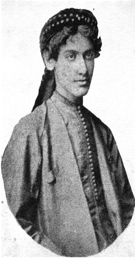
रवीन्द्रनाथ : १४ वर्ष